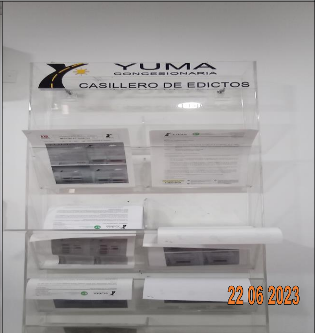
EDICTO R_37140 YC-CRT-128294